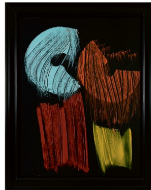
Hans Hartung (1904-1989) - « T 1971 - E7 » - Acrylique et grattage sur toile, 1971 - 130 x 102 cm - Estimation : 180 000 - 220 000

Le catalogue de la vacation ne se limite pas à ce chef-d'œuvre. Les amateurs pourront également découvrir des toiles, lithographies,