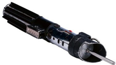
Sabre utilisé par Dark Vador dans Star Wars - Adjugé : 3,6 M$ (env. 3,07 M )

ADJUGÉ 3,6 MILLIONS de dollars lors d'une vente Propstore organisée le 4 septembre à Los Angeles, le sabre laser de Dark Vador vient de battre un record pour un objet Star Wars. Utilisée dans « L'Empire contre-attaque » (1980) et « Le Retour du Jedi » (1983), cette poignée originale, visible à l'écran, a été fabriquée à partir d'un ancien flash d'appareil photo et porte encore les traces de son usage lors des duels contre Luke Skywalker. Estimée entre 1 et 3 millions, la pièce, conservée près de 40 ans chez un particulier américain, a largement dépassé les attentes. Considéré comme l'un des accessoires les plus emblématiques de la saga, ce sabre confirme l'engouement mondial pour l'univers créé par George Lucas, rappelant qu'au-delà de l'objet, la puissance mythique de Star Wars continue de fasciner collectionneurs et fans.