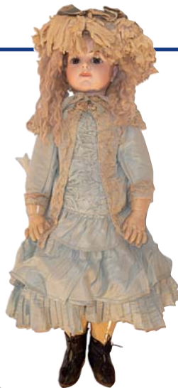
Poupée BRU Jne R, habits d'origine, taille 13. Ht. 75 cm.