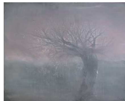
Yuri KUPER (1940) - Retour du printemps. Acrylique sur toile sur fond photo-radiographique. Signée et datée 95. 100 x 125 cm. D'un ensemble de deux œuvres.