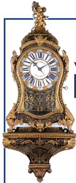
CARTEL D'APPLIQUE signé "LENOIR à LYON". Ép. Louis XV. Ht. 102 cm.

Expositions publiques : Vendredi 19 mars de 15h à 18h Samedi 20 mars de 10h à 12h et de 14h30 à 18h00 - Dimanche 21 mars de 10h à 12h