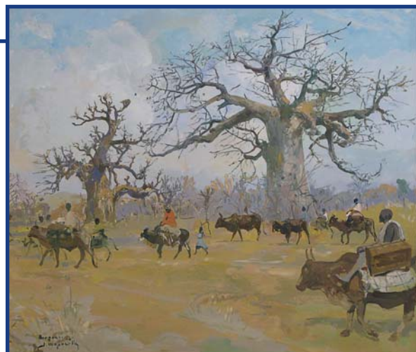
Jacques MAJORELLE (1886 - 1962) Baobabs à Bougouni (Mali). Gouache signée, située et datée 46. 76 x 88 cm.