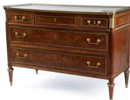
COMMODOE RECTANGULAIRE en acajou et placage d'acajou. Style Louis XVI. Ép. XIXe s. Ht. 89 x L. 128 x P. 58 cm.