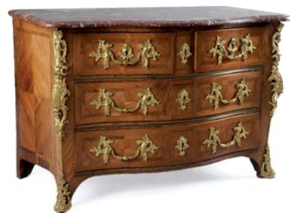
COMMODOE "TOMBEAU" à façade et côtés galbés en marqueterie. Estampillée IC Saunier . Époque Louis XV . Ht. 84 x L. 124 x P. 59,5 cm.