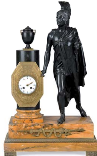
IMPORTANT PENDULE en bronze doré et patiné représentant Enée. 1ère partie du XIXe siècle. Ht. 78 x L. 47 cm.