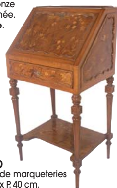
ÉMILE GALLÉ (1846 - 1904) Bureau de pente à décor de marqueteries florales. Signé. Ht. 97 x L. 50 x P. 40 cm.