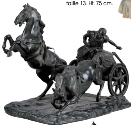
La course de char : GROUPE EN BRONZE à patine brune. Non signé. Ht. 54 x L. 59 x P.36 cm.