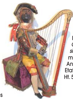
Gustave VICHY Paris 1890 Concertiste figurant un singe. Socle renfermant le mécanisme à 3 mouvements. Animation musicale. Etat d'origine. Ht. 50 x L. 35 cm.