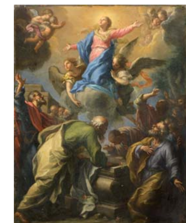
Étienne PARROCEL dit LE ROMAIN (Avignon 1696 - Rome 1775) L'Assomption. Huile sur cuivre. 38,5 x 30,5 cm.