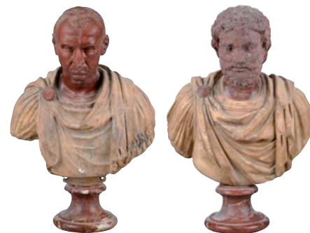
D'UN ENSEMBLE DE QUATRE BUSTES D'EMPEREURS ROMAINS en marbre polychrome et terre cuite. D'après l'Antique Italie XXe. Ht. 70 cm.