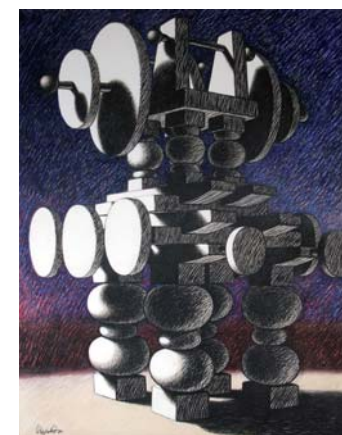
Ramon ALEJANDRO (1943) Composition, 76. Technique mixte sur toile SBG. 152 x 115 cm. D'un ensemble de quatre œuvres.