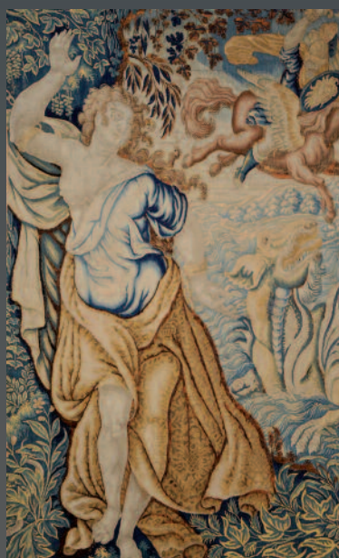
AUBUSSON : Fragment de tapisserie. Epoque XVIIIe siècle. 240 x 150 cm.