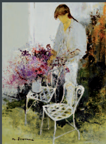
Michel JOUENNE (1933-?) : Fleurs de Jardin. Toile signée. 100 x 73 cm.